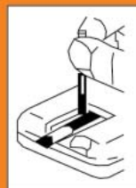
Нанесение на тест-полоску